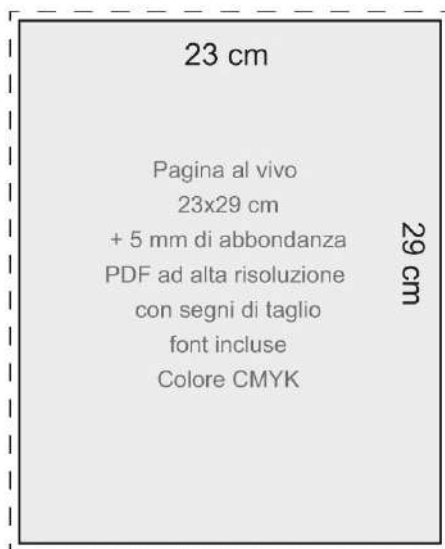
Pagina singola 23x29 cm